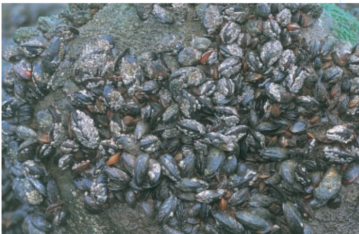
Klomp mosselen hechten zich vast aan de stenen constructie met behulp van hun baarddraden. Ze vormen een habitat voor vele andere organismen