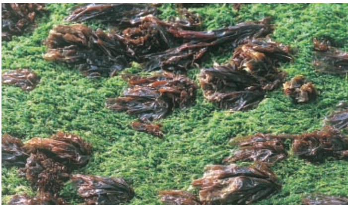
Op een strandhoofd komen Darmwier en Purperwier vaak samen voor (MD)

Meer naar laagwater toe komt een zone voor van dicht op elkaar zittende zeepokken. Vaak zijn ze bedekt met draadvormige kiezelwieren, die hen een bruine kleur geven. Zeer talrijk op strandhoofden is Elminius modestus , de Nieuw-Zeelandse Zeepok. Deze soort is na de tweede wereldoorlog langs onze kust opgedoken. Ze is blijkbaar zeer goed bestand tegen de schurende werking van het zand op en