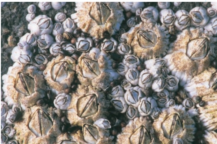
Zeepokken groeien dicht opeen in de middelste zone van het strandhoofd. Bij het uitglijden kunnen ze pijnlijk geschaafde knieën en handen veroorzaken (MD)