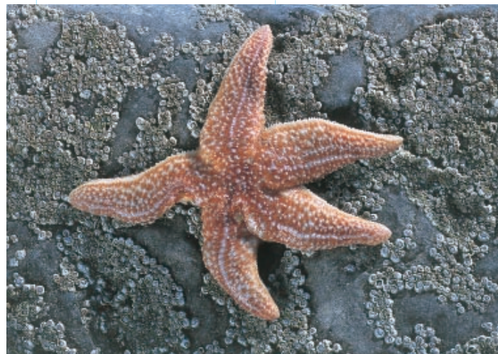
Asterias rubens is de meest bekende en meest algemene zeester van onze zeeën. Ze kan tijdelijk in zeer grote aantallen voorkomen op strandhoofden, waar ze zich voedt met mosselen, borstelwormen en kleine schaaldiertjes (MD)