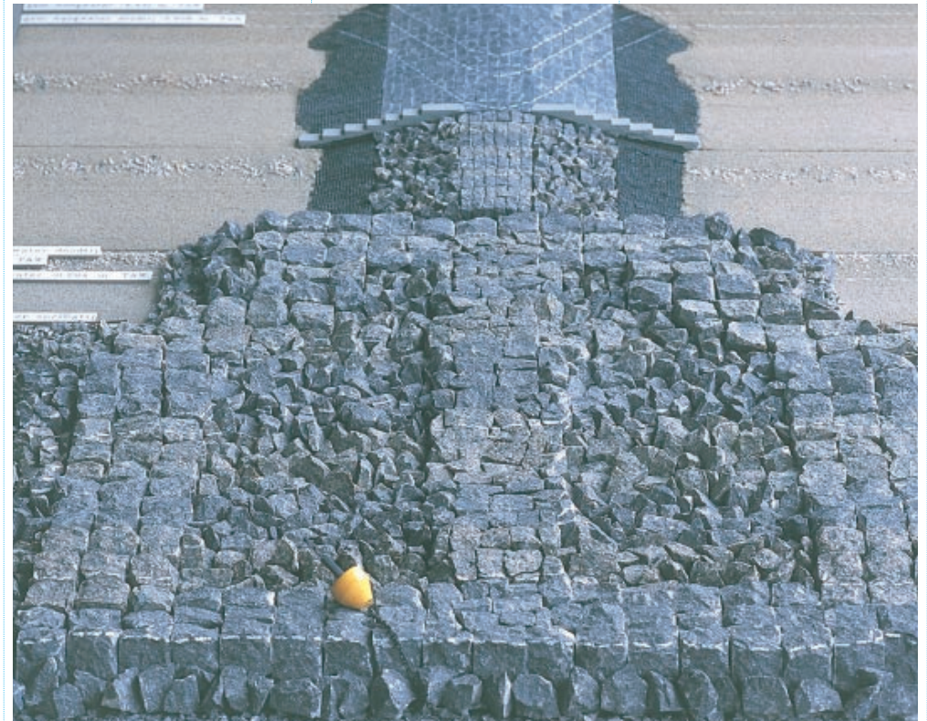
Bij nieuwe constructies zal men meer rekening gaan houden met mogelijkheden voor natuurontwikkeling. Dit schaalmodel illustreert een ontwerp voor een natuurtechnisch strandhoofd en beoogt een grotere diversiteit aan micro-habitaten (MD)

In augustus 2000 werden een 15-tal verschillende harde constructies langsheen de Belgische kust geïnventariseerd. Binnen kwadranten werden schattingen gemaakt van de aanwezige wieren en fauna (zowel vastgehechte als vrijlevende organismen)(AV).