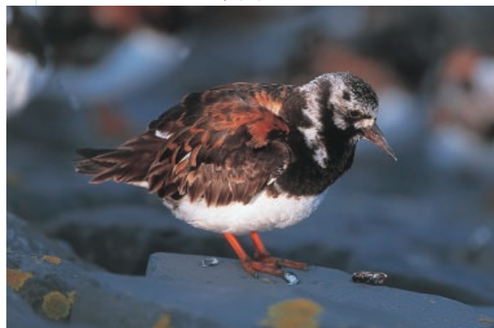
Stelllopers en meeuwen maken gretig gebruik van strandhoofden om er zich bij laag water te voeden. Eén van de meest typische stelllopers op strandhoofden is de Steenloper

rond een strandhoofd en verdringt er de inlandse Gewone Zeepok ( Semibalanus balanoides ). Meer zeewaarts komt een zone met mosselbedden ( Mytilus edulis ) voor. Recent worden ook steeds meer oesters aangetroffen op onze strandhoofden, voornamelijk op de meer beschutte plaatsen. De Oester Ostrea edulis is in onze streken quasi volledig verdwenen door de virusinfectie Bonamia en is er vervangen door de Japanse Oester ( Crassostrea gigas ), welke veel gekweekt wordt. De schelpdieren zijn dikwijls begroeid met Darmwier, Zeesla en Purperwier.