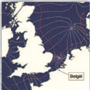
Afbeelding: verplaatsing van de getijgolf in de Noordzee

De getijgolf loopt niet zomaar over de oceanen. Ze moet langs de landmassa haar weg zoeken. Door de afbuiging van de golf langs deze landmassa ontstaan er grootschalige circulatiepatronen. In de figuur zie je de voornaamste stromingsrichting van de getijgolf in de Noordzee. Voor België is de onderste rode pijl van belang. Ze geeft de stromingsweg aan van de getijden in België en Frankrijk. Als het water opkomt stroomt het water richting Nederland. Als het water terugtrekt gaat het richting Frankrijk.